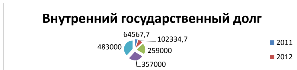
Рисунок 3 – Динамика внутреннего государственного долга с 2011 по 2015 гг.

дтоспособности по внешнему государственному долгу свидетельствуют о том, что Республика Беларусь относится к группе стран с низким уровнем задолженности.