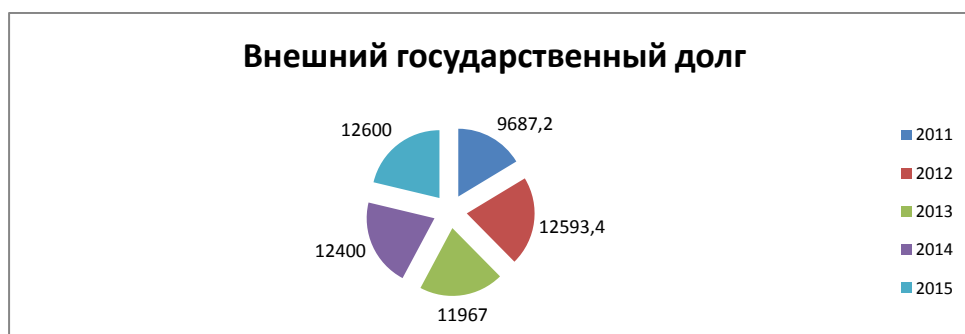
Рисунок 2 – Динамика внешнего государственного долга с 2011 по 2015 гг.

Государственный долг растет в разных странах разными темпами. Превышение государственного долга над выпуском валового продукта более чем в 2,5 раза считается опасным для стабильности экономики, особенно для устойчивого денежного обращения.