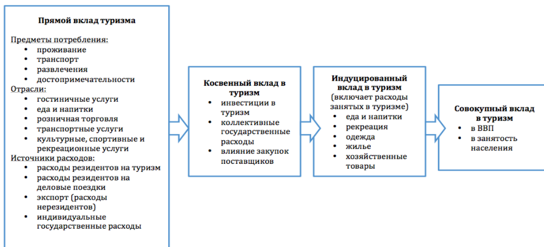
Рисунок 1 – Вклад туризма в экономику

В научной литературе не существует четкого определения того, что понимается под конкурентоспособностью, а в отношении конкурентоспособности страны существуют сомнения целесообразности применения данного термина в принципе [21].