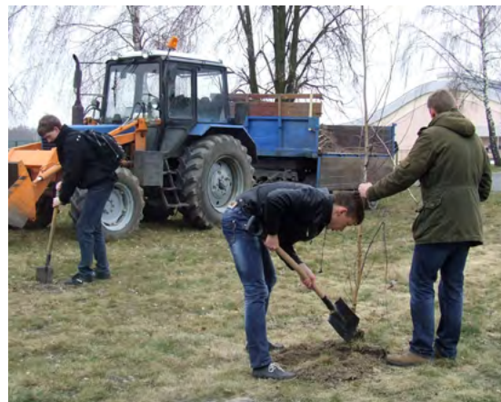
Студенты ПолесГУ на посадке березовой аллеи