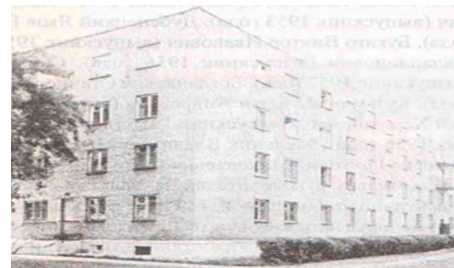
Общежитие техникума на улице Советской, 35

Для многих руководителей банков, как и для преподавателей техникума, объективно необходимой высшей ступенью обучения банковскому делу стал Белорусский государственный экономический университет. Некоторые выпускники техникума 60-х годов работали, а многие и продолжают работать в Белорусском государственном университете. Это Ноздрин-