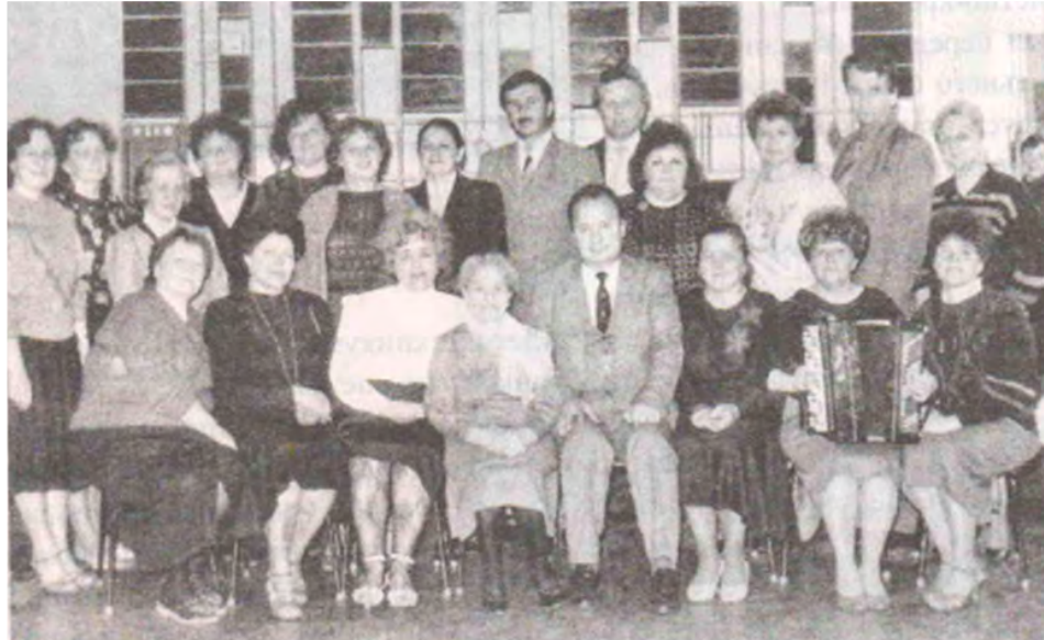
Коллектив техникума 1995 год