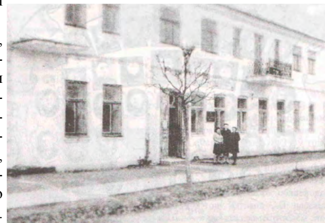
Учебный корпус техникума на улице Островского, 22 (в настоящее время улица Иркутско-Пинской дивизии, 22). 1948 год

Техникум начал работу в чрезвычайно трудных условиях. Не было учебников и учебных пособий, сложно было найти преподавателей, особенно преподавателей экономических и специальных банковских дисциплин. Привлекались для работы по совместительству преподаватели Пинского областного учительского института и специалисты Пинской областной конторы Госбанка СССР (Пинская область существовала до 8 января 1954 года), подбирались первые преподаватели техникума, были организованы подготовительные занятия с учащимися по программе 7-го класса общеобразо-