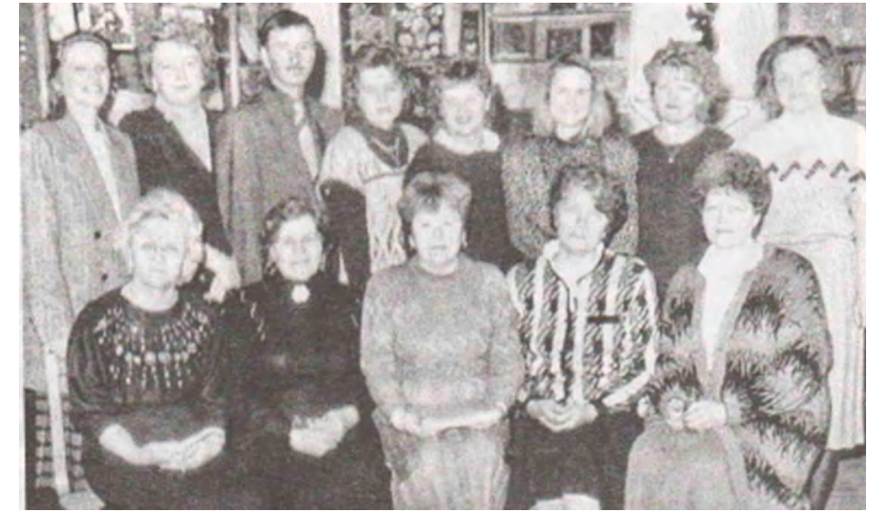
Преподаватели-выпускники техникума разных лет, 1994 год

Свидетельством исключительной популярности техникума среди средних специальных учебных заведений Беларуси был тот факт, что в середине 90-х годов конкурс заявлений абитуриентов был 29 человек на одно место. Стала осуществляться информатизация учебного процесса. В 1994 году было открыто заочное отделение по банковско-