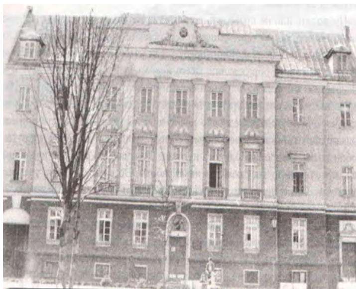
Учебный корпус техникума на улице Почтовой, 17 (в настоящее время улица Заслонова)

Город Пинск не случайно был выбран для размещения учебного заведения. В так называемый «польский» период (1921–1939) в Пинске работали десять кредитных учреждений: Полесский банк, Банк купеческий, Уездная сберегательная касса и другие. Уже тогда Пинск считался «банковским городом». При общей нехватке банковских кадров в стране в первое послевоенное время остро эта проблема появилась именно в учреждениях