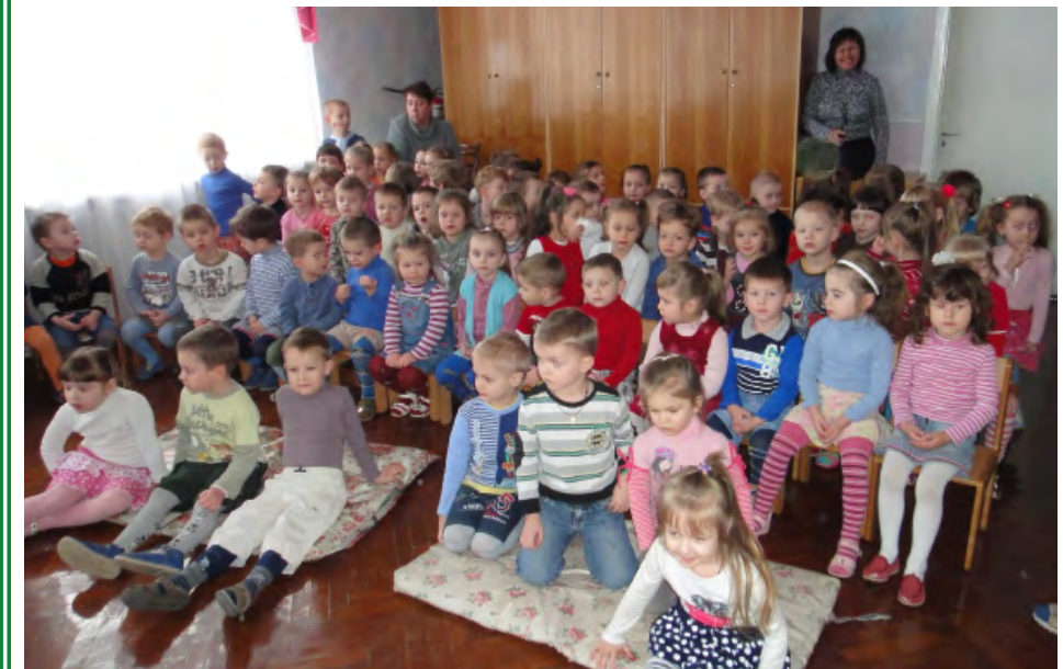
Сказка «Морозко» понравилась детям