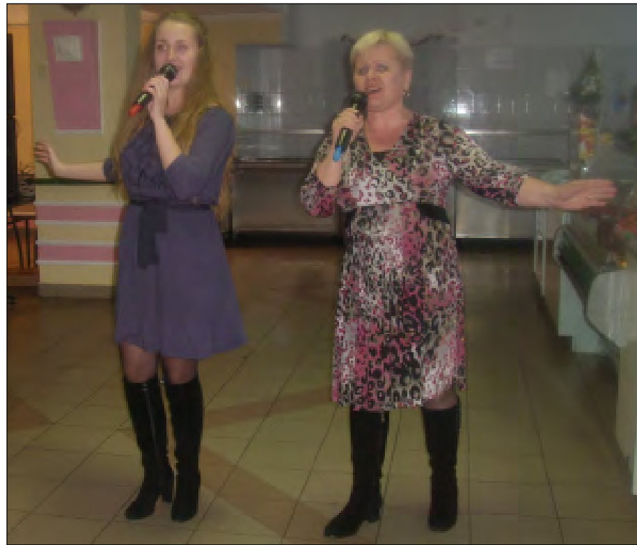
Поздравление ветеранов Полесского государственного университета и Национального банка с Новым годом