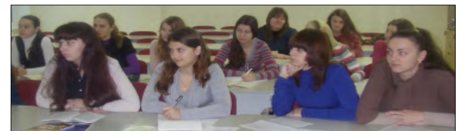
Студенты первого курса банковского факультета