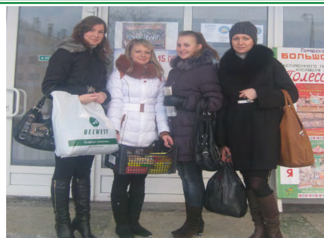
Студенты и сотрудники УО «Полесский государственный университет» приняли участие в I Епархиальном фестивале социальных учреждений «Рождественская радость» и передали детям-инвалидам и людям с ограниченными возможностями деньги, сладости, одежду и игрушки.