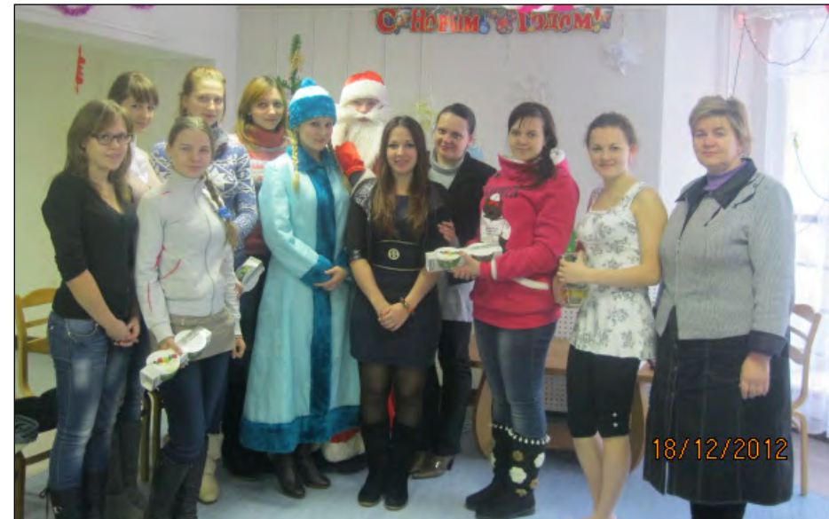
Поздравление молодых мам, студенток Полесского государственного университета, с Новым годом