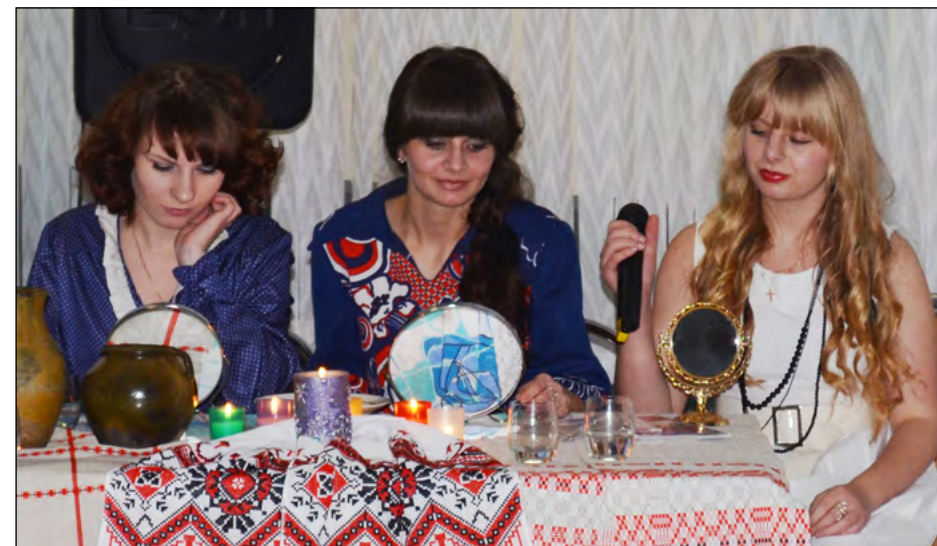
Новогодний праздник в Студенческой деревне, мюзикл «Вечера на хуторе близ Диканьки»