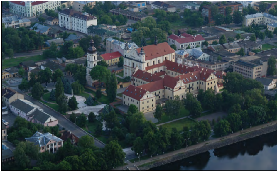
Центр города Пинска