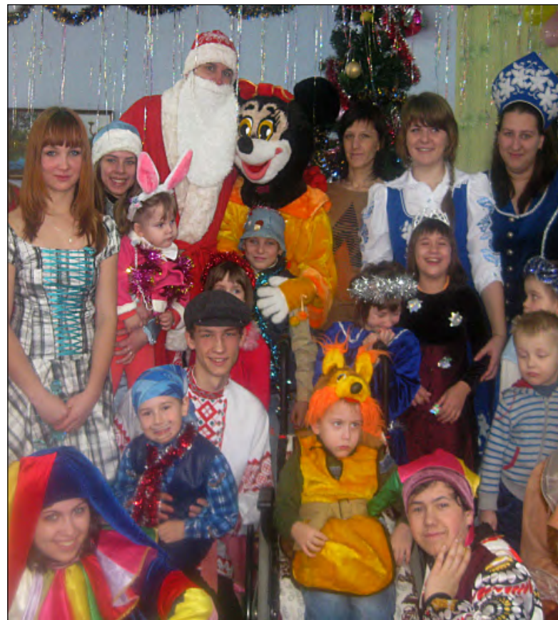
Новогоднее представление студентов ПО ОО «БРСМ» в районном социальном приюте г.п. Логишин