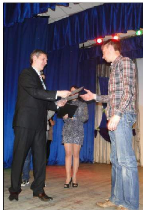
Студенческий совет экономического факультета

Процветай, наш любимый экономический факультет!