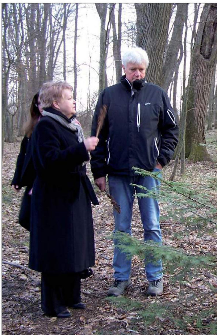
Господин Роге на экскурсии по Палесью

О неугасающем интересе к лекциям гостя говорит и то, что вся ауди-