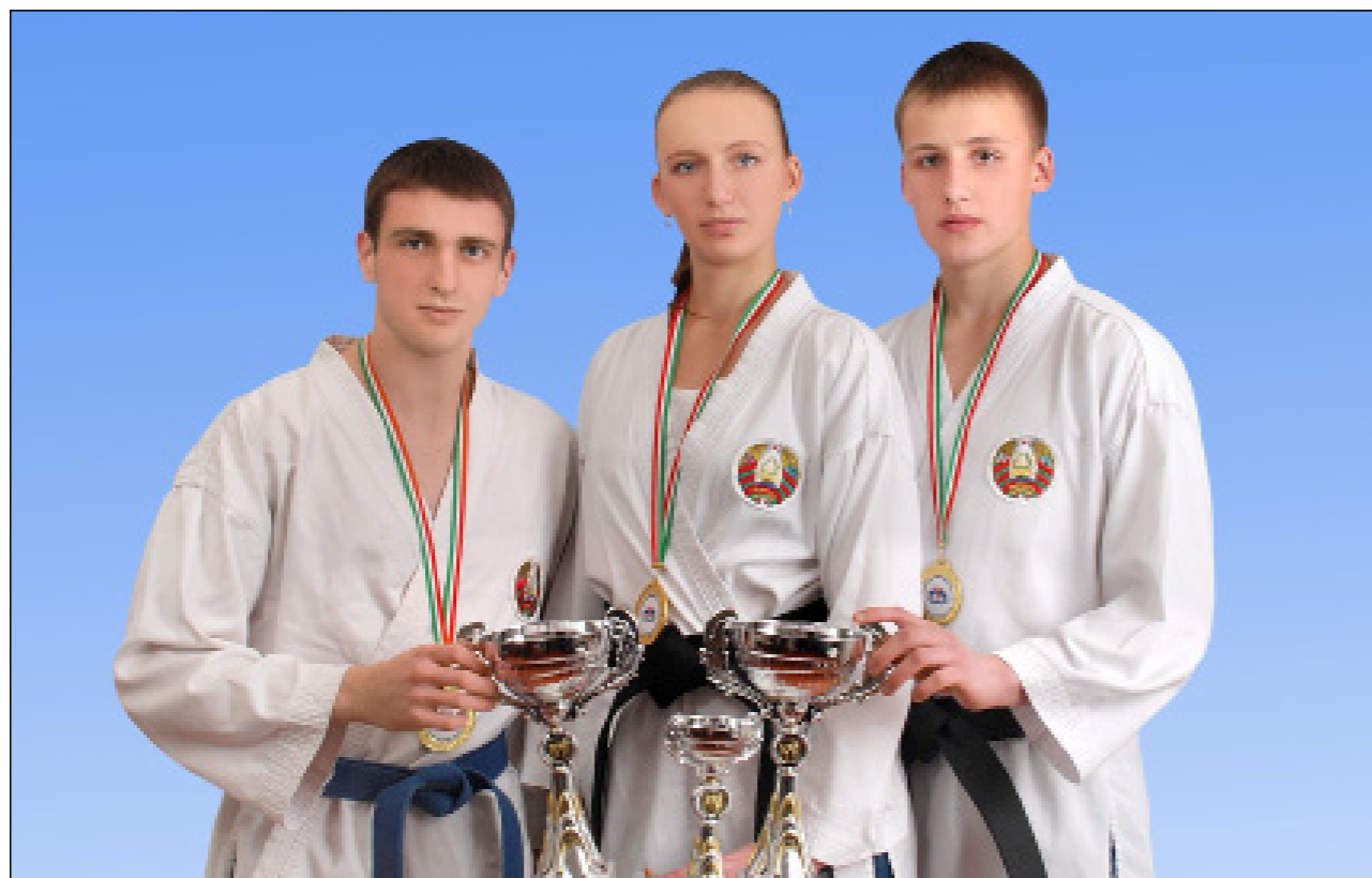
Гордость Полесского государственного университета

Всего два дня проходил чемпионат мира по шотокан каратэ-до SKDUN. В Милан приехали более 1400 каратистов из 32 стран Европы, Азии и африканского континента. В составе национальной сборной Беларуси были 11 пинчан — спортсменов молодежно-спортивного клуба «Сайва» и Центра физической культуры и спорта Полесского государственного университета. Сборная республики заняла общее четвертое место. Завоевана 21 медаль, из них 7 — золотых. Пинские каратисты в четырех разделах (трех личных и командном) также стали «золотыми».