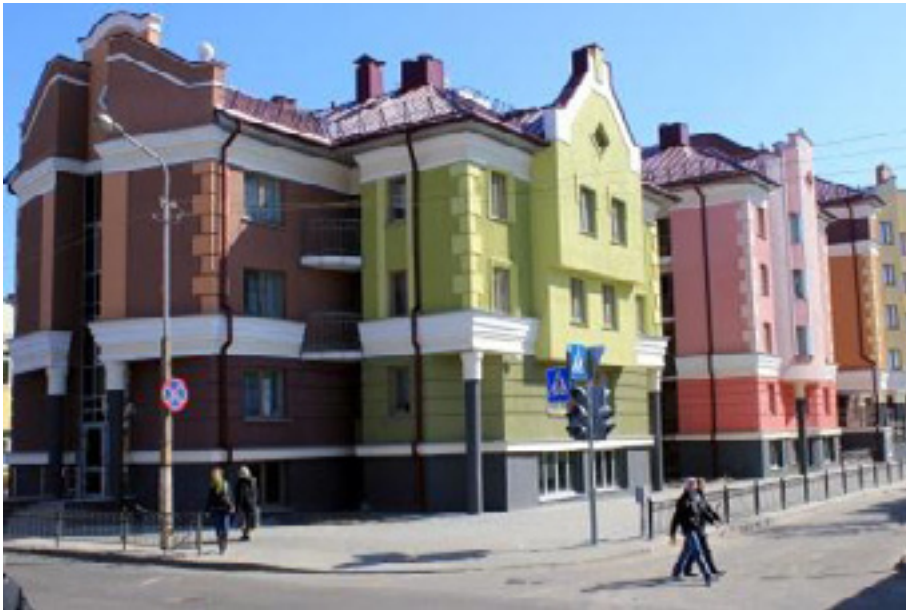
Общежитие Полесского государственного университета

... Каковы бы не были внешние обстоятельства, все же человек сам составляет мир. Ибо мир управляется и идет согласно идеям, чувствам, нравственным и умственным стремлениям человека, и от внутреннего его состояния зависит видимое состояние общества. Франсуа Пьер Гизо