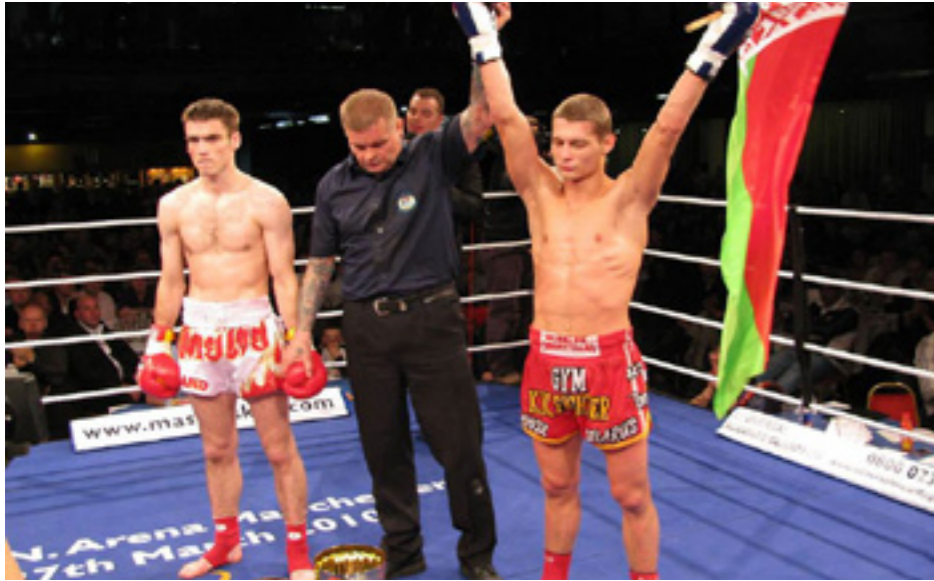
Чемпион мира Андрей Кулибин

Тайский бокс или муай тай — боевое искусство Таиланда, произошедшее из древнего тайского боевого искусства муай боран. Термин «муай» исходит от санскритского мавья и тай, в переводе означая «поединок свободных» или «свободный бой».