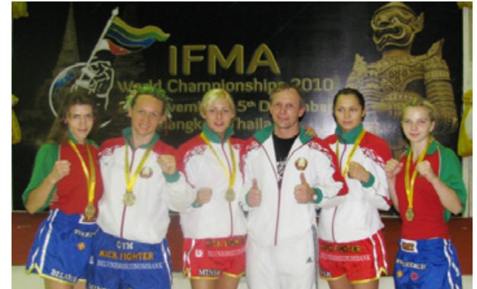
Женская белорусская сборная по муай-тай

или тренер. В Таиланде монгкон, равно как и танец рам муай, может указывать на принадлежность бойца к той или иной школе или географическому региону.