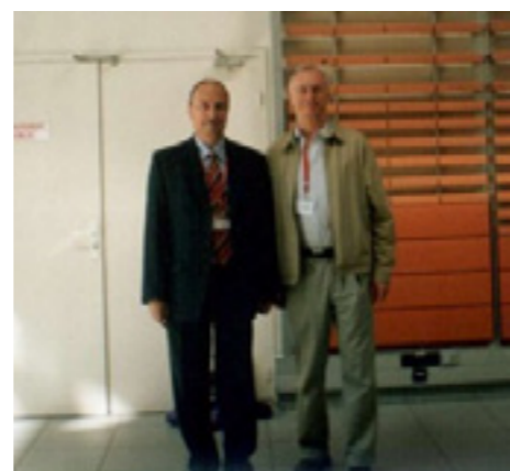
4 международный конгресс по клеточной молекулярной биологии, Пуатье, 2005 год