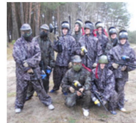
К бою готовы!

Дух соперничества, ощущение драйва и адреналина охватило игроков с первой минуты игры. Команды тща-