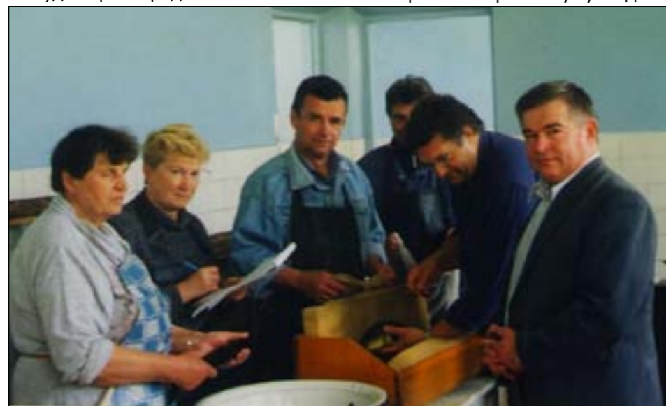
Воспроизводство лена в рыбхозе «Белое»