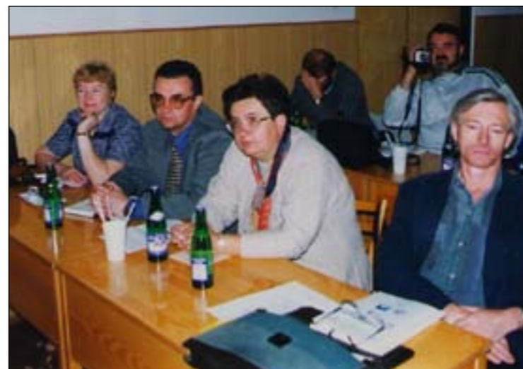
На научной конференции в Чехии