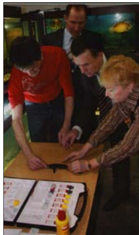
Экспериментальная лаборатория Полесского государственного университета