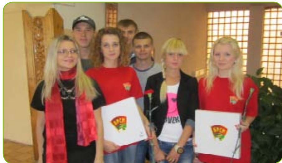
Активисты ПО ОО «БРСМ» поздравляют впервые голосующих