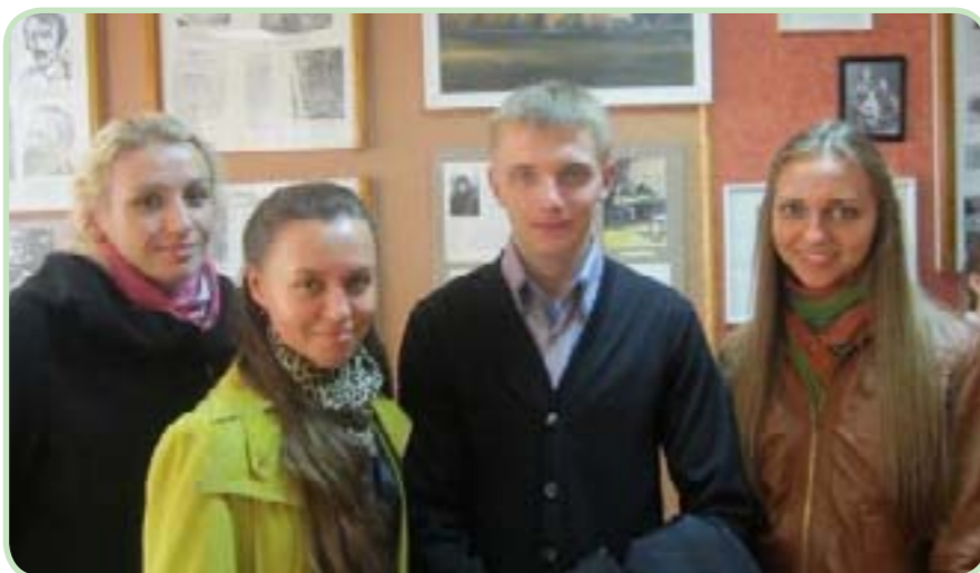
Перспективная молодёжь Полесского государственного университета