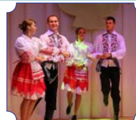
Ансамбль эстрадного танца «Альянс»

ния студенческой молодежи. Студклуб организует культурный досуг, способствует созданию благоприятных условий для развития самостоятельного творчества, художественных и интеллектуальных способностей. Цель – повышение эффективности и качества психолого-педагогического сопровождения учебно-воспитательного процесса в университете, формирования и развития у студентов психологической, духовной культуры. Студенческий клуб выполняет следующие функции: