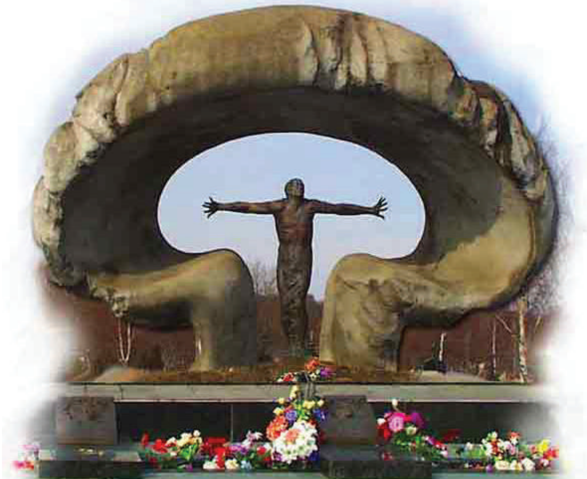
Памятник ликвидаторам аварии на Чернобыльской АЭС