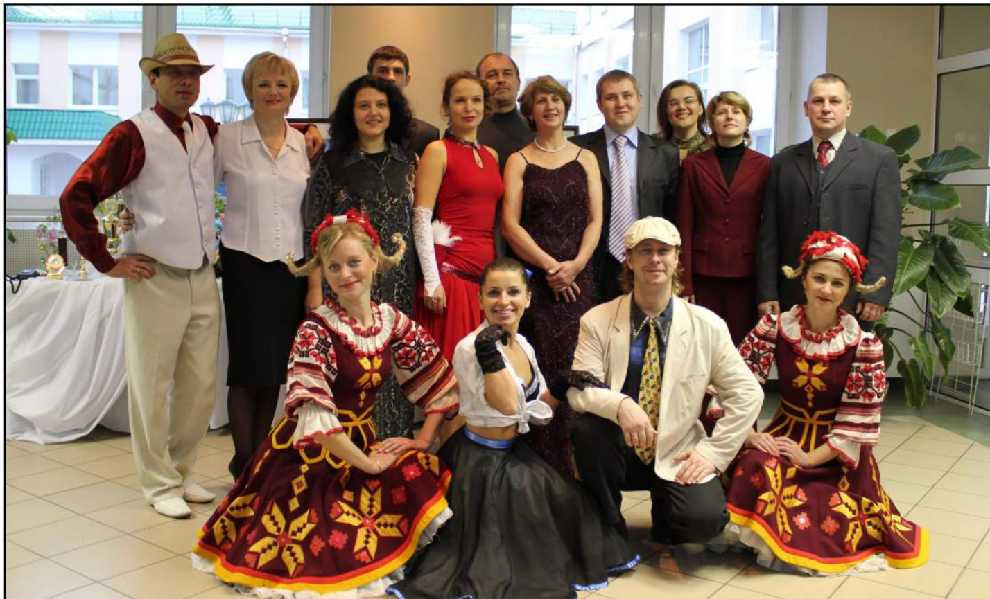
Творческий коллектив Полесского государственного университета

Атмосфера фестиваля, несомненно, праздничная. Атрибуты, дух творчества, яркие номера, коллективизм, дружба, возникающая при подготовке фестиваля – все это оставляет самые приятные впечатления и заставляет с уверенностью утверждать: фестивалю быть!