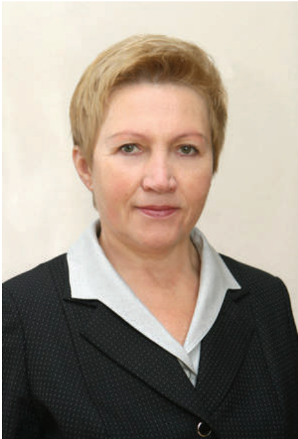
Ермакова Надежда Андреевна

Доктор философии, в области информационных технологий, доцент. До июля 2011 года Председатель Правления открытого акционерного общества «Сберегательный банк «Беларусбанк». С июля 2011 года Председатель Правления Национального банка Республики Беларусь.