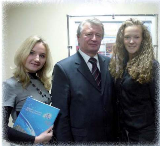
Встреча студентов экономического факультета и факультета банковского дела с Министром образования А. Радьковым

банка Республики Беларусь, 1 человек – стипендия Совета учреждения образования «Полесский государственный университет», 2 человека – профсоюзных стипендий обкома и республиканского профсоюза работников государственных и других учреждений.