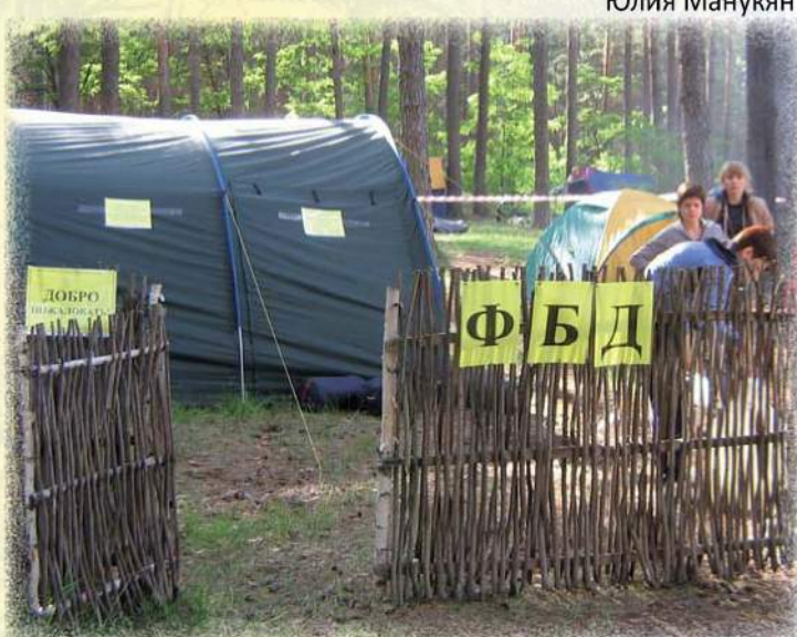
День рождения факультета