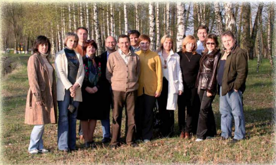
Участники 3 международной научно-практической конференции «Устойчивое развитие экономики: состояние, проблемы, перспективы»

Раз уж я затронула тему праздников, то нельзя не отметить, что факультет имеет укоренившиеся традиции. На мой взгляд (да и на взгляд других студентов тоже), главная из них – празднование Дня рождения факультета (30 октября). Что особенно важно: отмечают этот праздник абсолютно все студенты ФБД. «Такого не бывает», - возразят критики, и будут не правы. Дело в том, что одни студенты