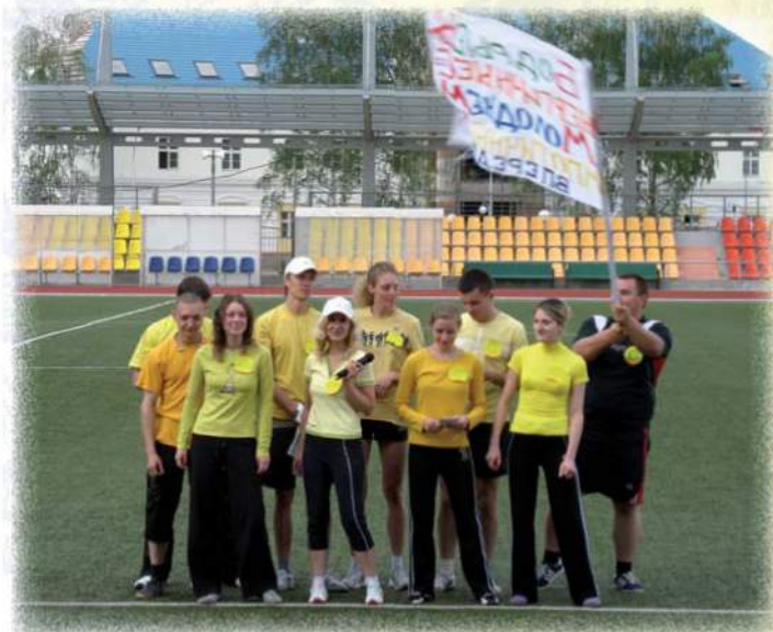
Неделя моды на здоровье