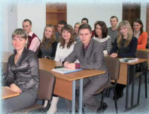
Встреча студенческого актива с редактором газеты «Народная трибуна»

В течение нескольких лет студенты факультета являются участниками волонтерского отряда и продолжают шефство над городским приютом, Домом малютки. Участвуют в проведении благотворительных акций, концертов, оказывают помощь ветеранам войны и труда, одиноким людям.