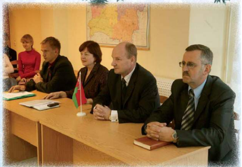
Сложилась система встреч ректората со студентами на факультетах, в общежитиях

По вопросам формирования здорового образа жизни у студенческой молодежи деканат факультета сотрудничает с городской организацией Красного Креста, центром эпидемиологии и гигиены города, отделом культуры горисполкома, центром профилактики СПИДа.